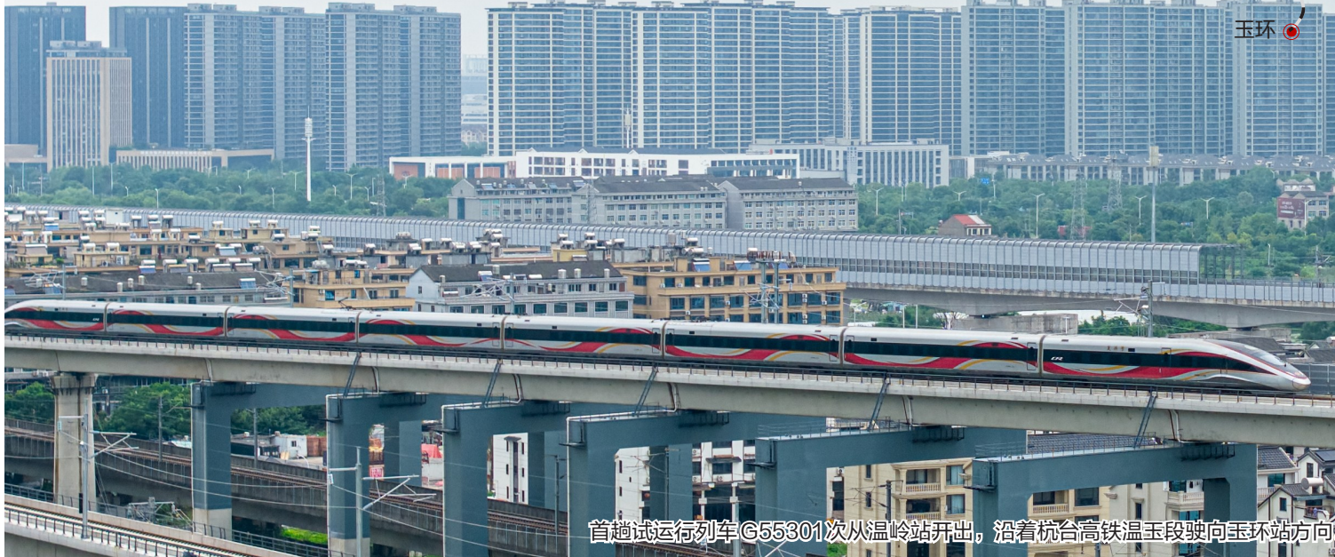
首趟试运行列车G55301次从温岭站开出，沿着杭台高铁温玉段驶向玉环站方向。