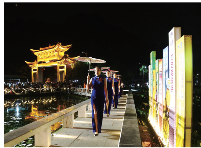
方山村百亩荷塘边上演村晚节目。

本报讯(通讯员杨鹏)日前,大溪镇方山村百亩荷塘畔灯火璀璨、人头攒动,“好市连连”主题村晚精彩上演。本地村民和“文艺轻骑兵”共同呈献的演出,不仅丰富了村民生活,更带火了当地莲子夜经济,为乡村振兴再添动力。