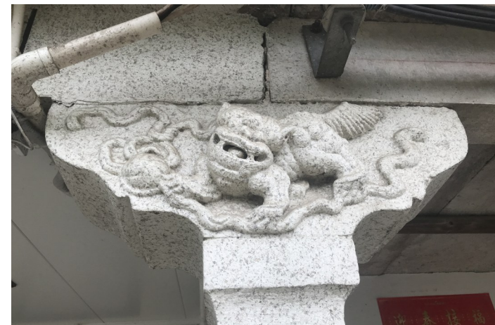
蔡洋村大寮屋石雕。