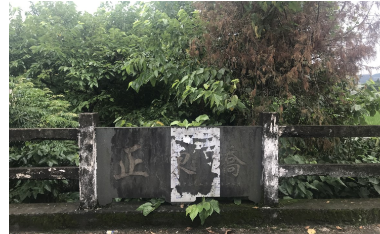
蔡洋村正东桥，村民以父亲名义捐资建造。