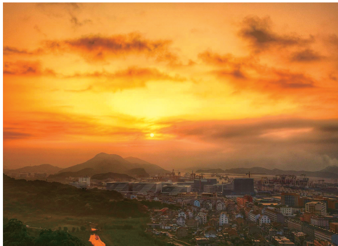
@琼川山人: 日月同辉。