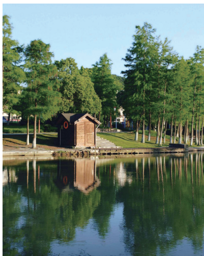
@“谢”意人生: 光落在绿意里。

放慢脚步, 诗意触手可及。温岭的浪漫, 藏在山海与烟火之间。摄影师们用镜头定格家乡千姿百态, 爱上一座城, 只需这样一个瞬间。