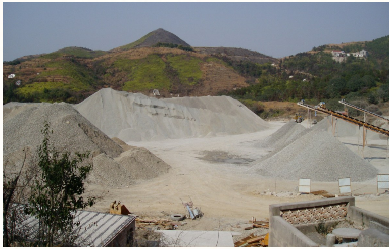
孟家岙“大坟坦”曾经被改成石子场。

为判定石刻文物年代，研究者曾邀请临海籍文保专家彭连生实地鉴定，初判石像为南宋遗存，这一结论也曾引发不同看法。直至今今年5月初，笔者将这批石刻与温岭妙严寺内南宋名臣王居安祖父墓前石翁仲比对，并联合多位专家研讨，最终确定文物均为南宋时期遗存。