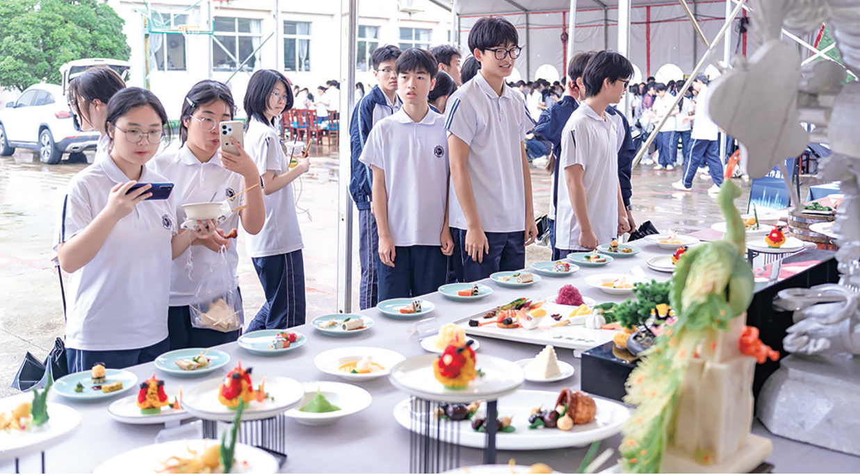
厨艺展示区吸引许多学生围观。