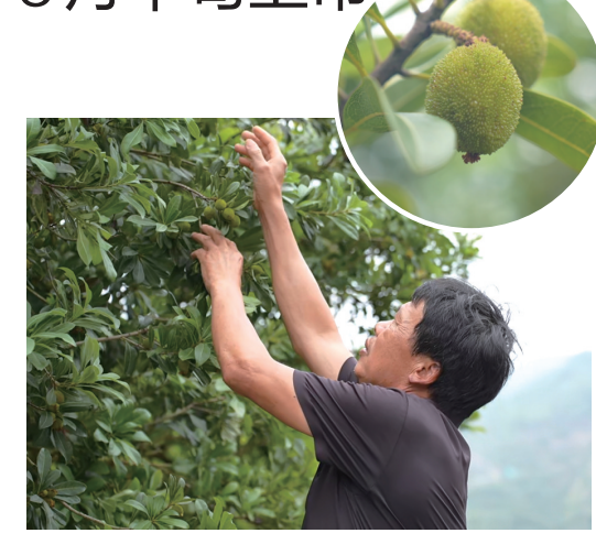
种植户检查杨梅长势。

本报讯（记者陈小一/文）初夏时节，杨梅进入花果管理关键期。全市杨梅长势喜人，预计6月中旬陆续成熟上市。梅农采取科学疏果、物理防控、精准施肥等精细管护措施，全程坚守绿色生态种植标准，以绿色种植筑牢安全防线，让每一颗杨梅都香甜可口、放心可尝。