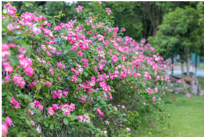
下保山公园内，也有一面月季花墙。