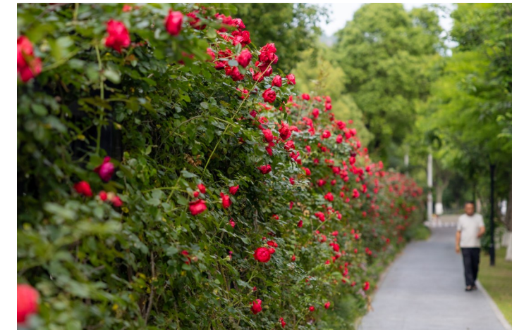
城东街道蔡家河(市融媒体中心大楼南面)沿河绿道。

记者从市植物园了解到，月季花期较长，每年初夏和秋季通常会出现2至3次盛花期，园内赏花期可持续至9月下旬。此外，8月至10月，市民还可欣赏到娇艳的千日红，9月中旬至11月则有粉黛草接力登场，实现四季皆有景可赏。