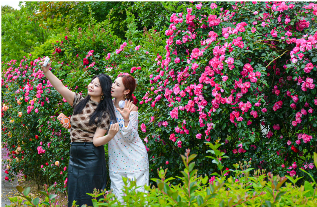
植物园内，不少市民在花墙前打卡拍照。记者 朱丹君 摄

本报讯(记者朱丹君 通讯员林品远/文 记者徐杰/图)初夏时节，温岭街头巷尾、公园绿道处处繁花似锦。一株株月季迎着明媚的阳光热烈绽放，红如火焰、粉若云霞、黄似流金，整座城市仿佛化身为一座大型月季主题花园，吸引市民纷纷驻足打卡、拍照分享，主动化身