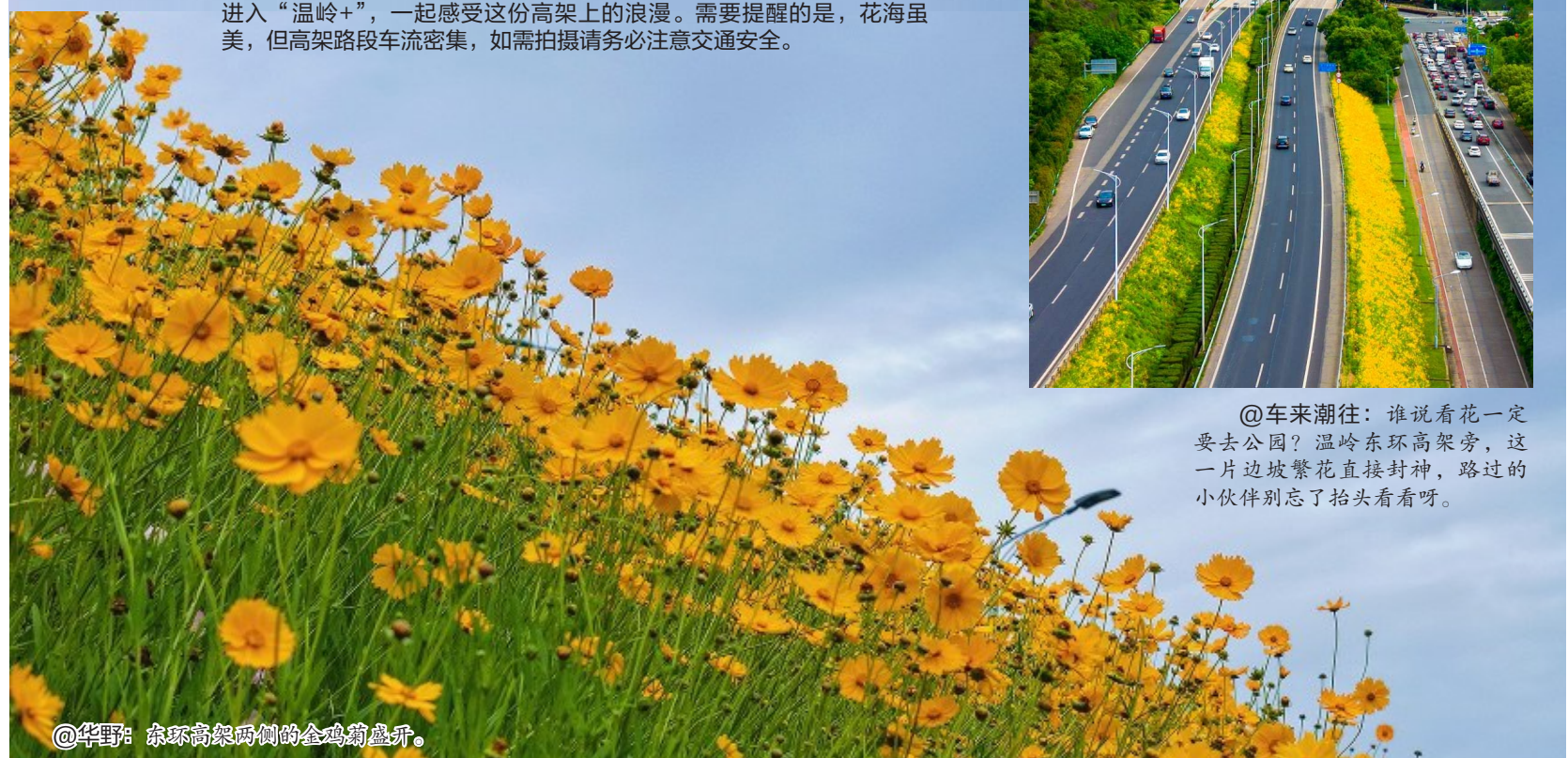
@车来潮往: 谁说看花一定要去公园? 温岭东环高架旁，这一片边坡繁花直接封神，路过的小伙伴别忘了抬头看看呀。

金黄花浪，正沿着温岭东环高架两侧翻涌。连日来，道路旁的金鸡菊进入盛花期，绵延成一条流动的“金色花带”。打开掌上温岭App，进入“温岭+”，一起感受这份高架上的浪漫。需要提醒的是，花海虽美，但高架路段车流密集，如需拍摄请务必注意交通安全。