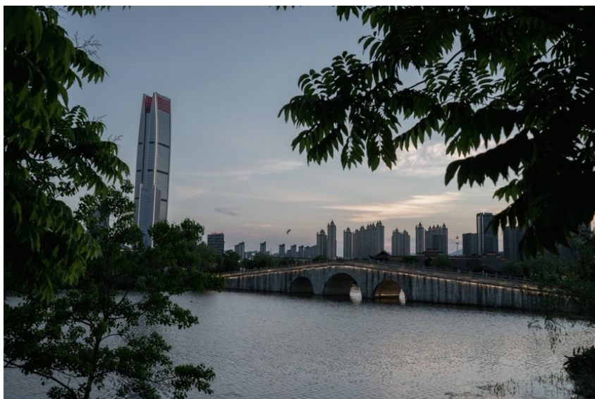
@扛相机的莫小姐: 温岭九龙湖风采。