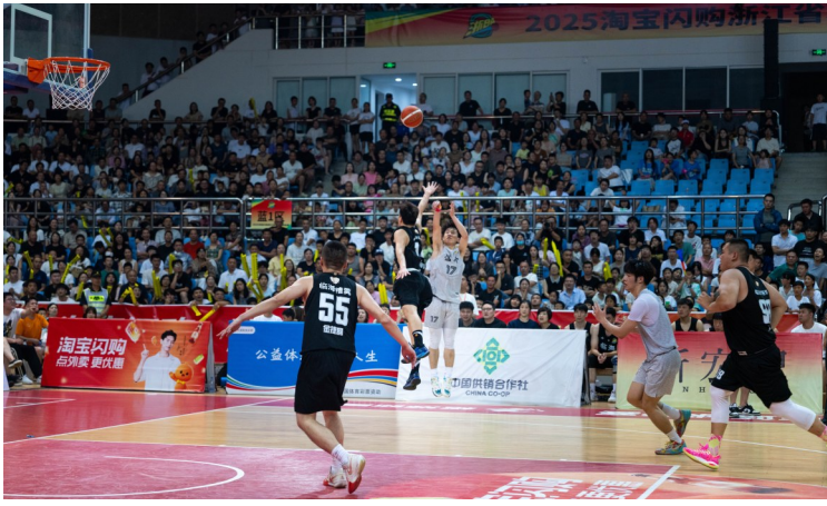
2025年7月18日，浙BA温岭对战临海。

本报讯（记者江潇扬）“五一”期间，温岭体育馆里的篮球热情高涨。5月2日至4日，温岭、平阳、永康、龙泉四支浙BA集训队伍将在这里展开为期3天的浙BA四地交流赛。