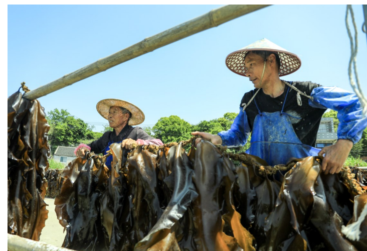
眼下,坞根镇迎来海带大丰收,鲜品亩产量超万斤,创下近年来新高。依托乐清湾优良的浅海生态资源,坞根镇的海带养殖已有30余年历史。