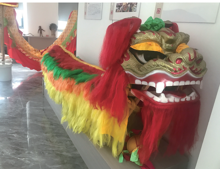
龙狮道具进文化礼堂。