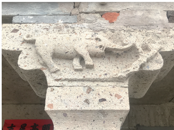
南洋岙村大寨屋石雕。