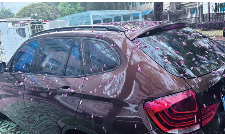
@菠萝包男孩：雨打桃花，落了满车温柔。原来春天最浪漫的停车费，是一整车的花瓣。