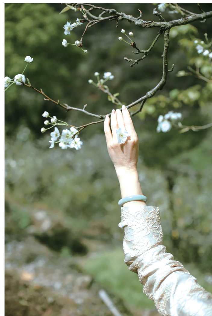
城东乌龙香，老屋、梨花、青苔石阶，在春天的角落里，与山风对坐，与花影同行。