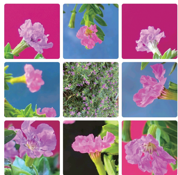
@菠萝包男孩：雨打桃花，落了满车温柔。原来春天最浪漫的停车费，是一整车的花瓣。

不是昙花一现的惊艳，是细水长流的陪伴。细叶萼距花，以一整个四季的盛放，诠释什么是“永不落幕的温柔”。#草木有灵 #紫色浪漫 #日常小美好 #植物治愈力