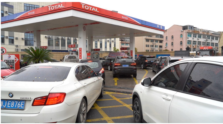
加油站内汽车排起长龙。

边,仍在源源不断地驶入。现场工作人员穿梭在车流中,疏导交通。为了应对激增的车流,加油站全员上岗,部分员工的工作时间也从平时的晚上9点延长至午夜12