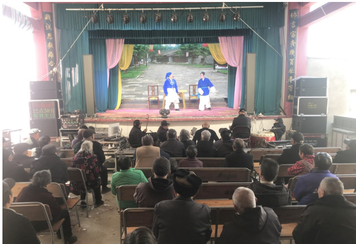
台七所城隍庙社戏。