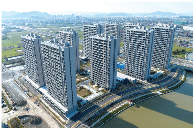
下蒋公寓式住宅项目（湖镜园北院）正有序推进选房安置等后续工作。

在横峰全域改造工业安置项目（M23-2地块）现场，多台打桩机正加紧作业，打造一个功能