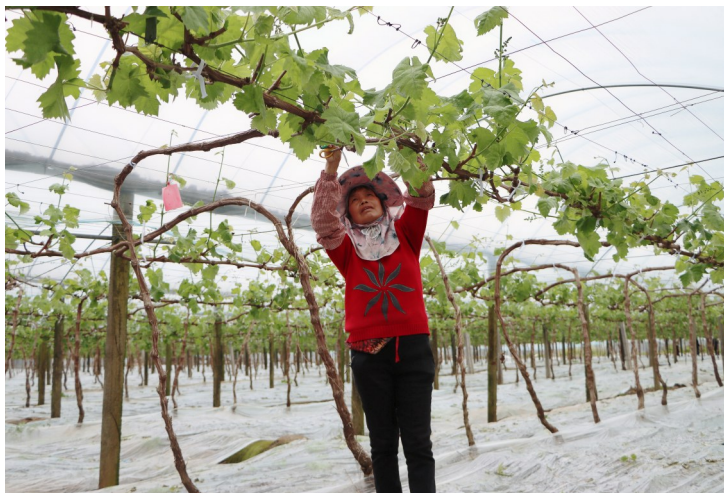
工人们正在修花剪枝。

温岭素有“大葡萄之乡”的美誉，果农们的种植经验丰富。今年春耕，当地的“三膜覆盖”促早技术再升级，融入了省农科院的智能“黑科技”。智能传感器、水肥一体化设备、补光灯全天候“站岗”：温湿度实时监测，数据直达农户手机端；水肥配比自动调节，精准供给每株葡萄；阴雨天气