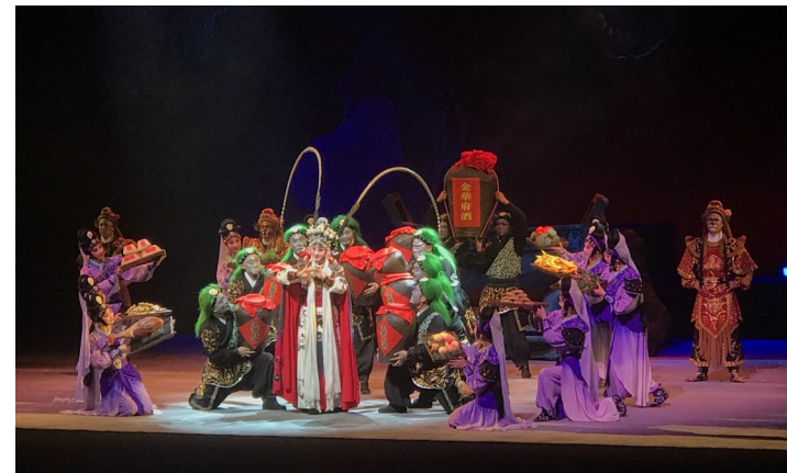
婺剧《三打白骨精》剧照。

本报讯（记者黄晓慧）近日，新版婺剧《三打白骨精》在温岭大剧院精彩上演。浙江婺剧艺术研究院（浙江婺剧团）的演员们为观众带来了一场高水平的戏曲视听盛宴。