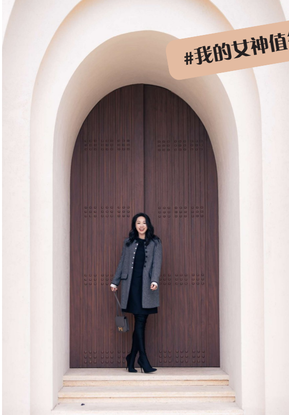
@最爱高跟鞋: 自信，热烈，笃定，我就是自己的女神。

每个人心里，都有一个“值得夸”的她。 为迎接“三八”妇女节，掌上温岭App“温岭+”推出#我的女神值得夸话题征集活动，面向广大网友征集身边优秀女性的暖心故事与闪光瞬间。活动得到网友们的积极响应，今天，让我们一同感受她们的不凡风采。