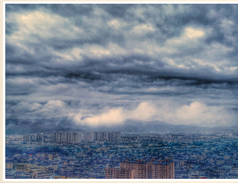
@琼川山人: 山在雾中藏。