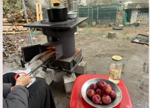
@搭讪都怕收费: 最长情的告白就是陪伴。这会儿在陪我烧柴。

每个人心里，都有一个“值得夸”的她。 为迎接“三八”妇女节，掌上温岭App“温岭+”推出#我的女神值得夸话题征集活动，面向广大网友征集身边优秀女性的暖心故事与闪光瞬间。活动得到网友们的积极响应，今天，让我们一同感受她们的不凡风采。