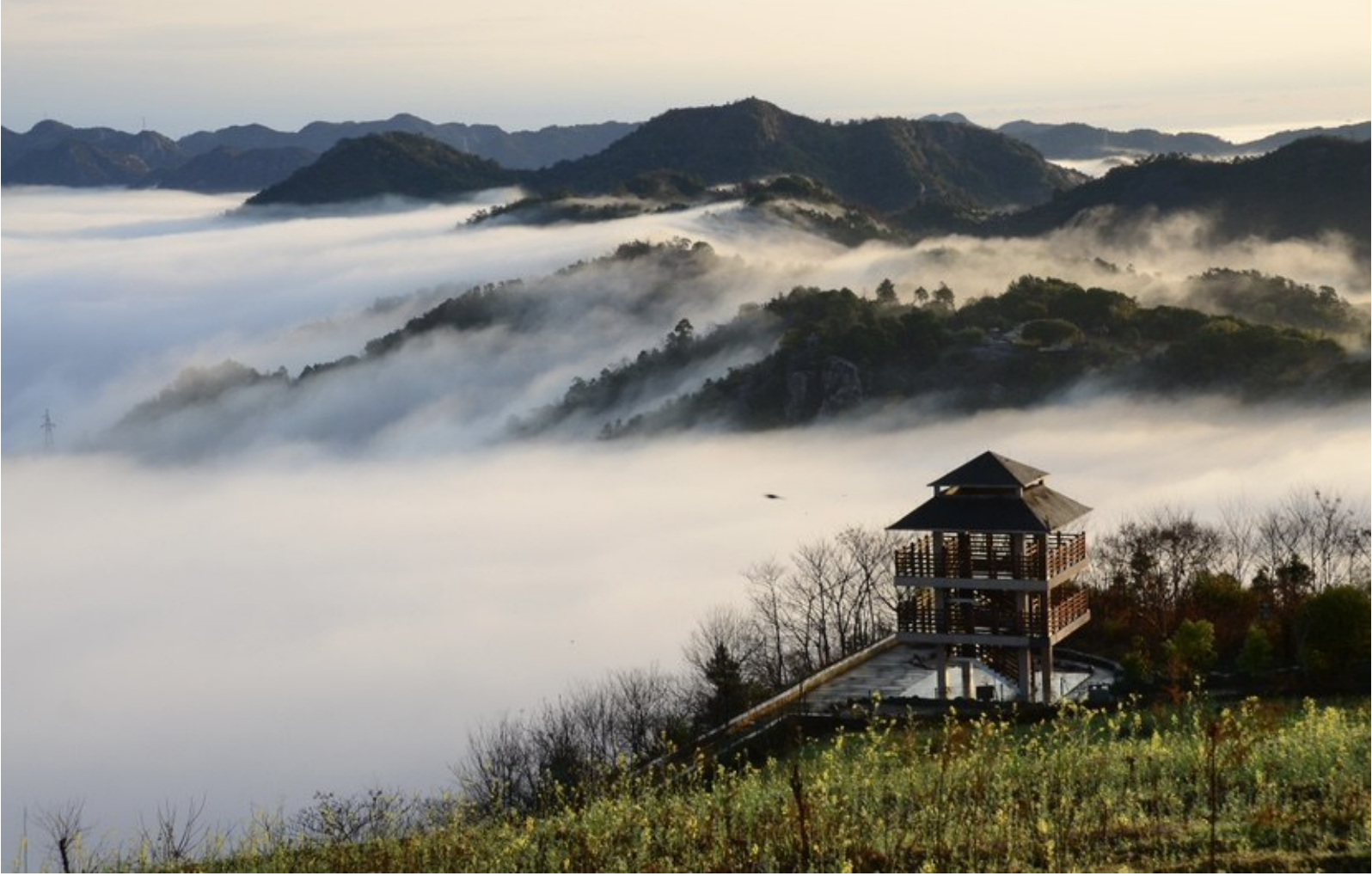
@寒江渔翁: 藤岭晨雾。