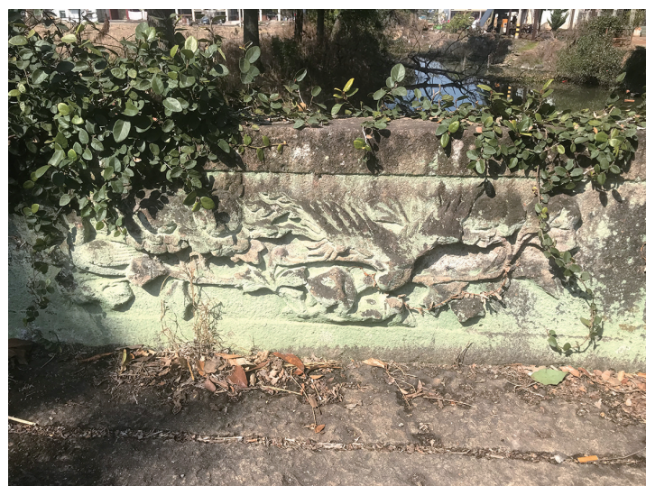
秧田桥上的精美石雕