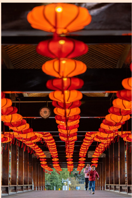
湖心公园长廊挂起串串红灯笼。