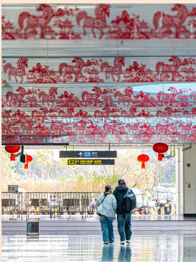
轻轨站里的“新春皮肤”。