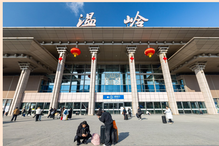
温岭市火车站喜庆的氛围为即将出行的人们送上祝福。