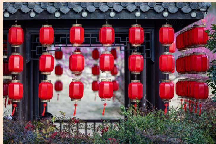
五龙山公园张灯结彩,迎春纳福。