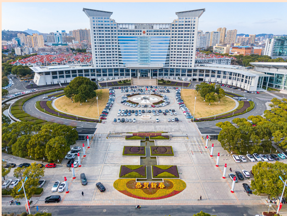
温岭市政府向全市人民“恭贺新春”。