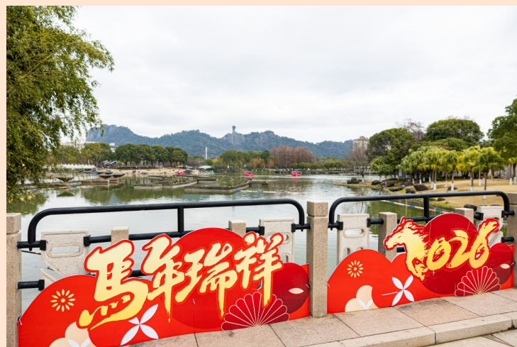
锦屏公园内全新“马年景观”亮相。