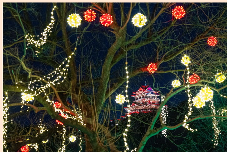
夜幕下的东辉公园美不胜收。