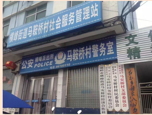
横峰街道马鞍桥村。