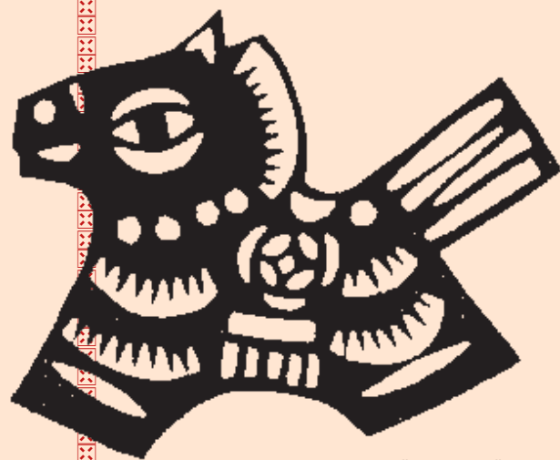
郭献忠剪纸《十二生肖》中的马。