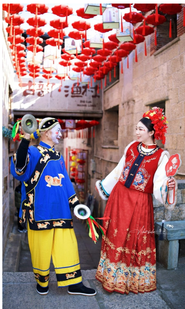
@李白姓白： “当簪花遇上大奏鼓”~国风故事感拉满。