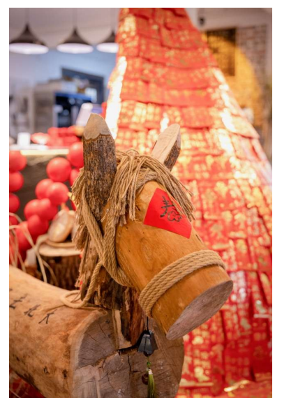
@车来潮往： 暖融融的厅堂里漾开新春的喜气，圆木小马静立光影交叠间，满屋尽是团聚的暖意与新年的期盼。