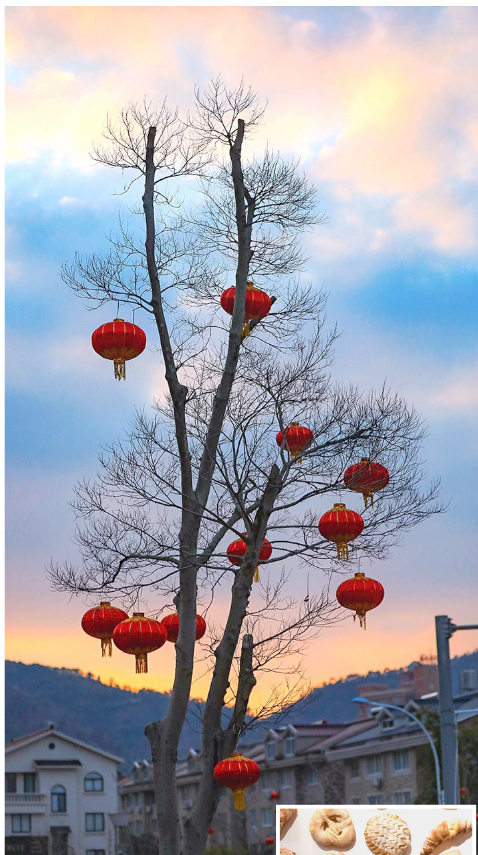
@华野： 早上的天空有点美。