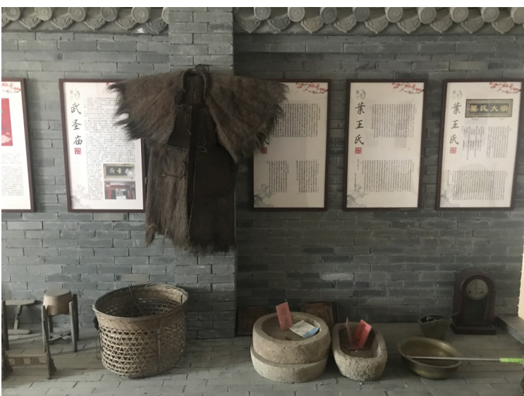
文化礼堂内的老物件。