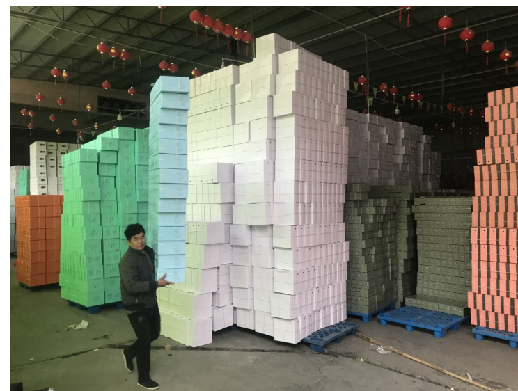
戏台前成为了仓库。