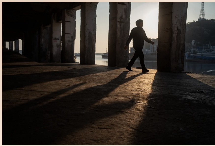
@蓝精灵号：冬日夕阳下。