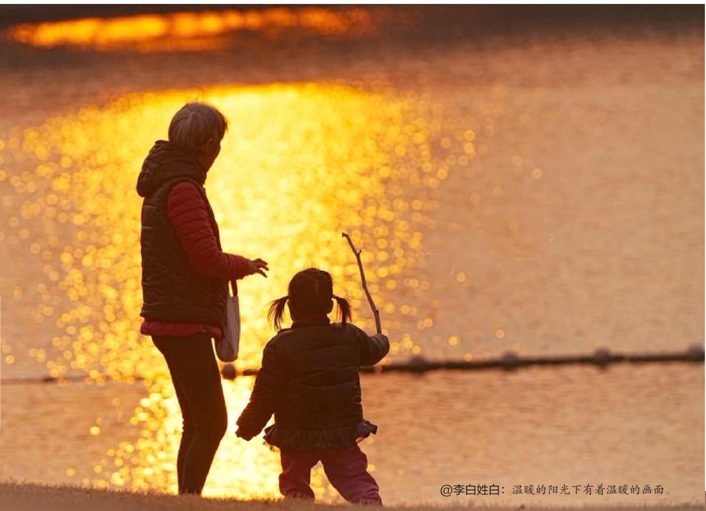
@李白姓白：温暖的阳光下有着温暖的画面。

清晨的雾气裹着山海，晨霜薄覆在石墙上，水边的薄冰映着淡淡的微光，等暖阳爬上来驱散凉意；傍晚夕阳染红天际，将水面的波光一并融进暮色里。“温岭+”的摄影师们用镜头记录这些冬日常常，其中，藏着温岭冬天最实在的暖意与韵味。