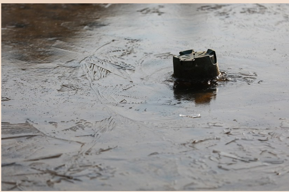
@华野：早上湖漫水库的薄冰。