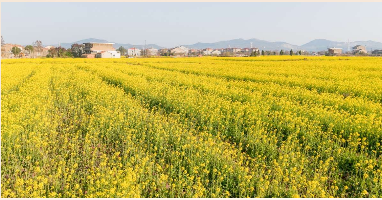
@车来潮往：在松门镇松建村，成片的油菜花冬日里竞相开放，金黄色的花田与民居、田野相映成趣。