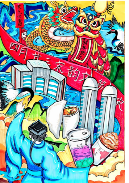
大溪小学六(5)班 谢灵熙 指导老师 赵媚媚