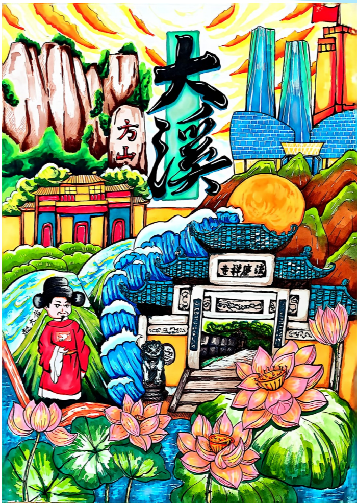
大溪小学五(2)班 张译兮 指导老师 赵燕飞