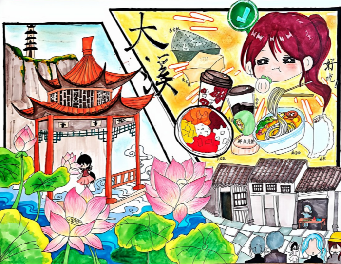
大溪小学六(4)班 谢雨馨 指导老师 洪巧宜