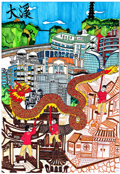
大溪小学六(5)班 杨澜淇 指导老师 张颖