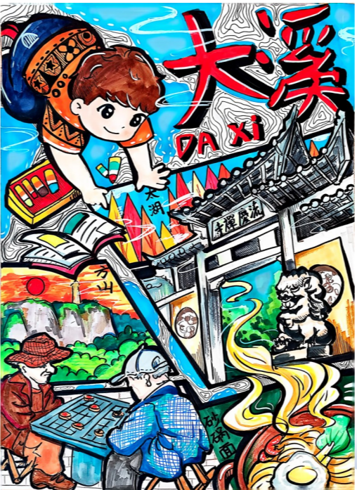
大溪小学五(1)班 赵颖程 指导老师 杨青青