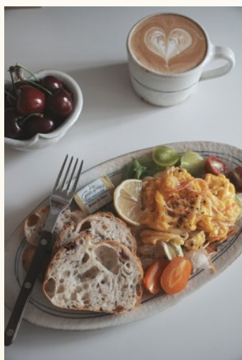
@林太：美食治愈一切。