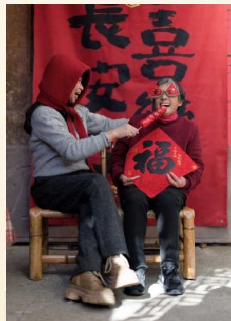
@蓝精灵号：没有华丽的服饰，没有精致的妆造，发自内心的笑容才是最好的PS。