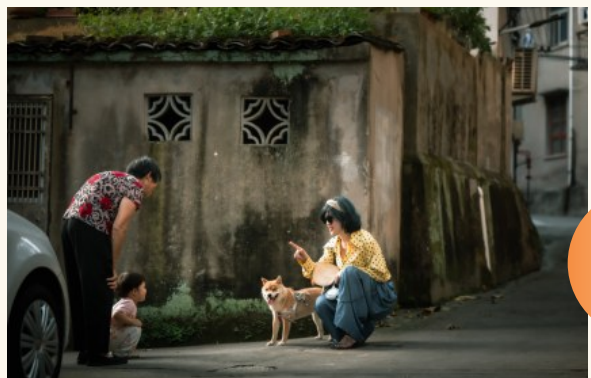
@星星牧歌：老街旧巷，写满岁月悠长，我爱这城市平凡一角，赠予你。