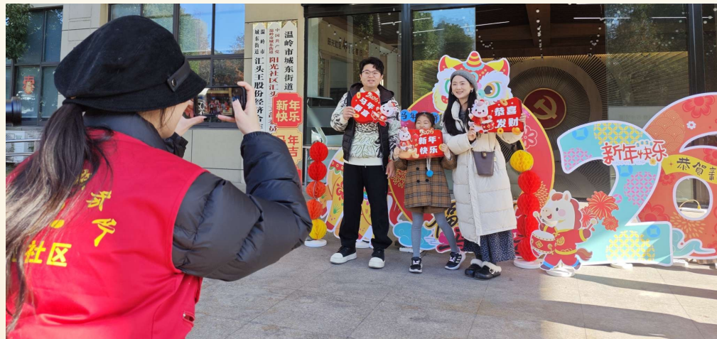
@阳光社区：阳光社区举办“福满邻里·趣迎新春”元旦集福活动，吸引百余位居民热情参与。

自2025年2月，报纸开设“温岭+”社区活动板块以来，已累计刊发600余篇，生动展现了基层治理的创新活力与人文关怀。