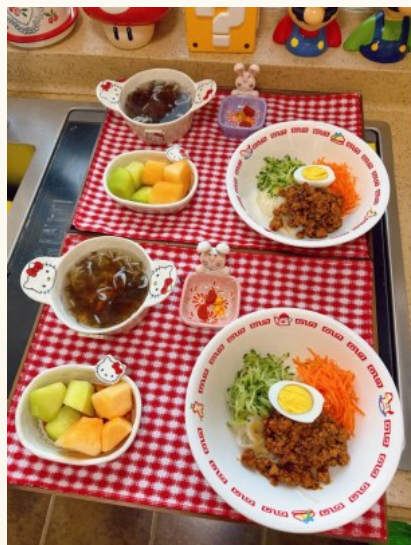
@猪猪侠和牛魔王：#我家早餐不重样#坚持为家人做早餐的第100天。