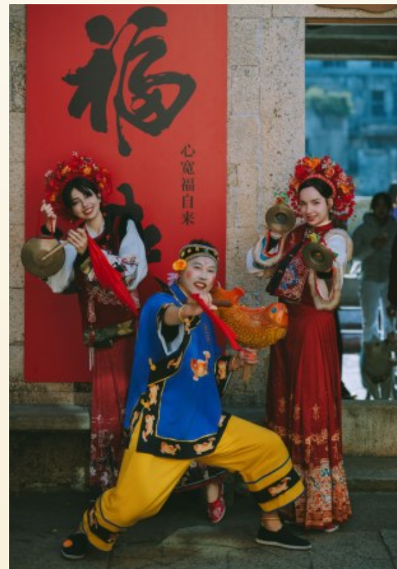
@阿牛：跨越山海，在温岭石塘里落村，让外国朋友把东方簪花的浪漫戴在头上。

2025年，“温岭+”因每一个发光的你而充盈。2026年，愿我们继续在此相遇，记录、分享、连结，让无数微光，汇成更璀璨的星河。