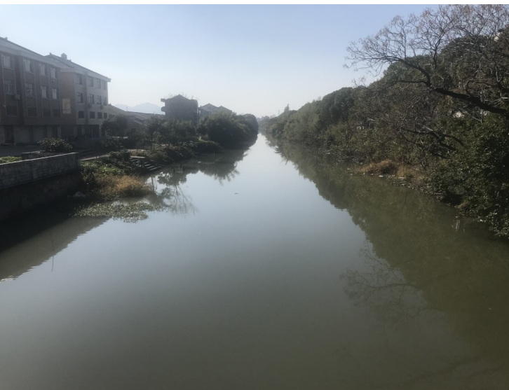
廿四弓河良种村段。

在孟岳闸西边不远处，有一条四福河与廿四弓河相接，四福河以西，梁良公路拐弯后与坦龙线相