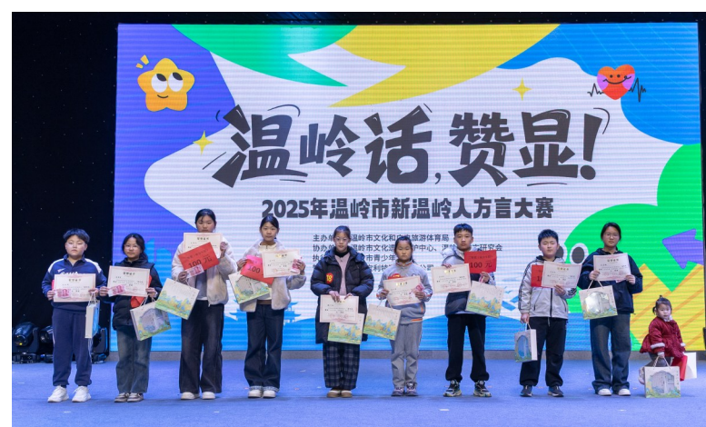
图为青少年组部分获奖选手合影。

本报讯（记者郑菁瑶/文 通讯员毛志豪/图）“做戏法”“雨花毛”“一声弗响”……12月28日下午，市青少年宫内乡音缭绕，“温岭话，赞显！”2025年新温岭人方言大赛决赛在此举行。成人组与青少年组的选手们登上舞台，在比拼中展现了对第二故乡文化的深刻认同与热爱。