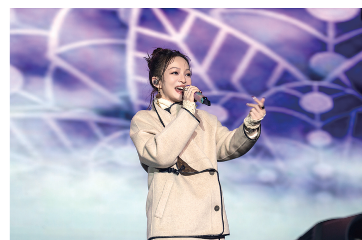
张韶涵在表演。

为保障观众顺利出行，我市交管大队提前谋划、精准施策。我市当天开通3条免费公交接驳专线，19:30前从银泰城、金麟府等地共发出22班接驳车，散场后预备了20辆公交车有序疏散，累计运输600余名观众；台州市域铁路S1线同步调整运营，城南站至台州火车站方向加开2列次，最晚发车时间延至22:10。周围设置16个停车