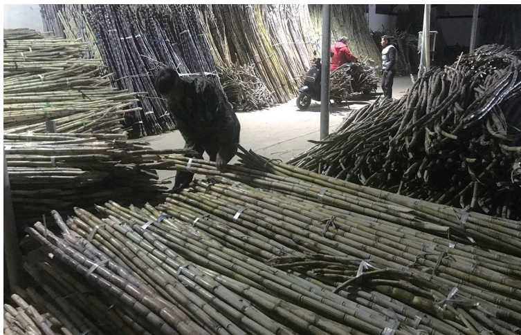
榨汁车间内堆满了甘蔗