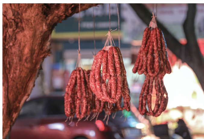
拍摄地: 市区文化桥菜市场附近