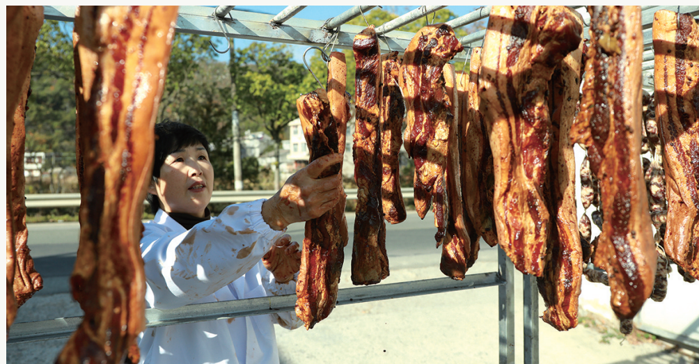
拍摄地: 城南镇吞环街村