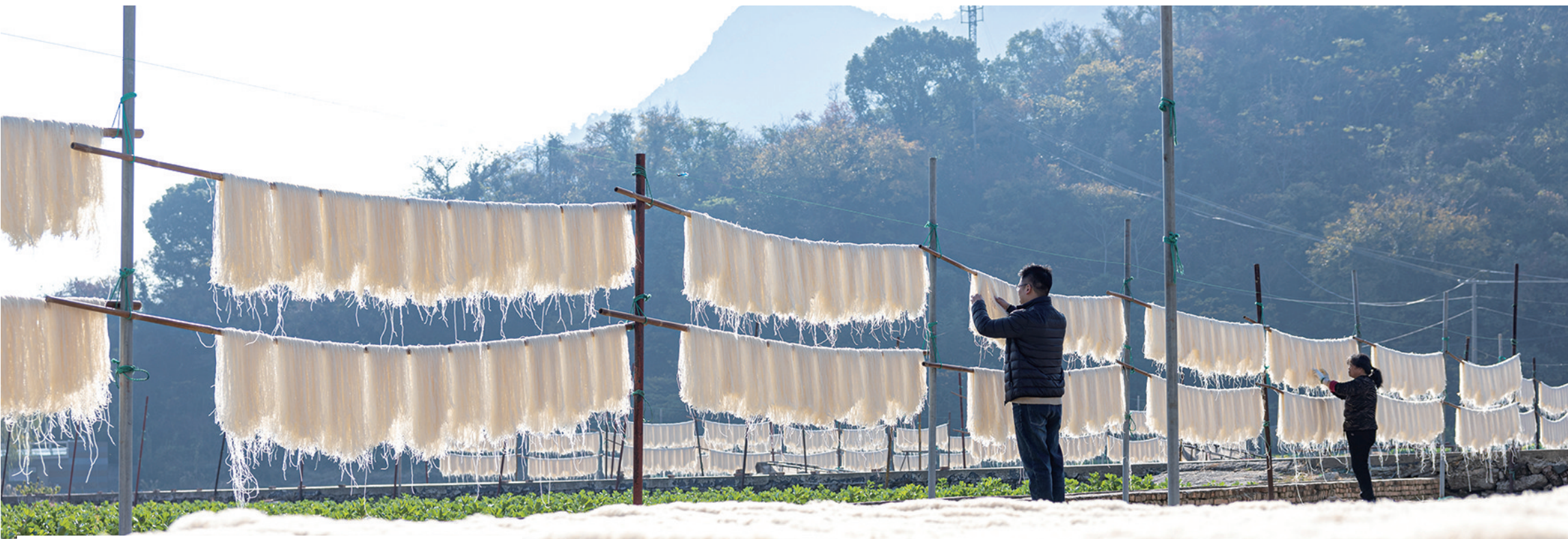
拍摄地: 石桥镇西城新村 记者 徐伟杰 通讯员 蒋友彬 摄