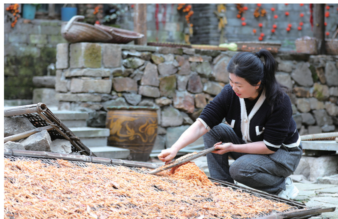
拍摄地: 太平街道吞底杨村