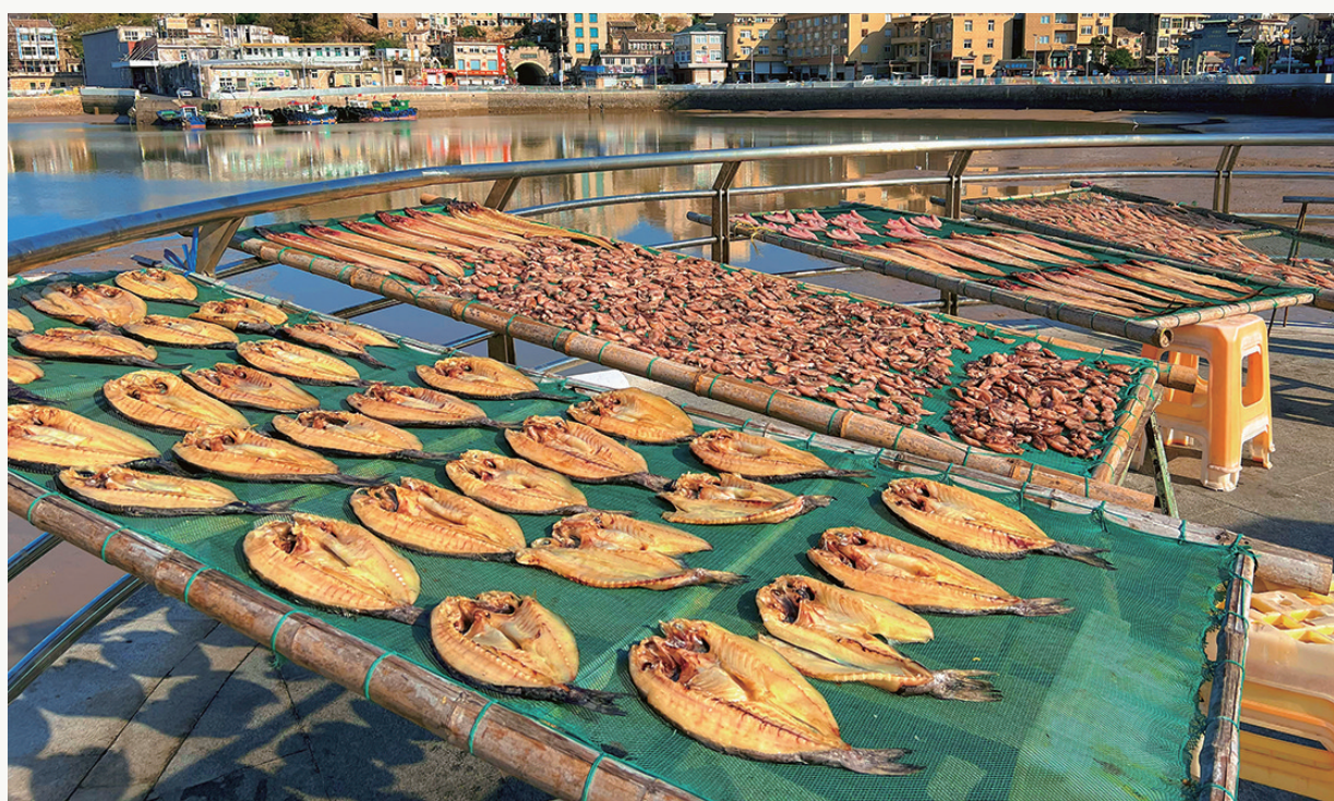
拍摄地: 石塘镇东海村