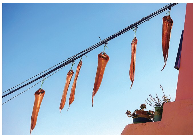
拍摄地: 石塘镇东海村