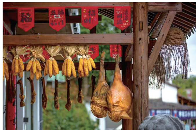
拍摄地: 江西婺源