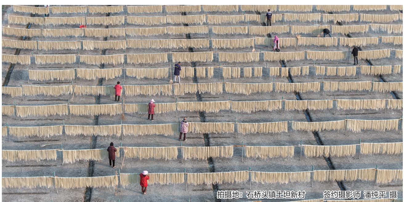
拍摄地：石桥头镇土坦新村