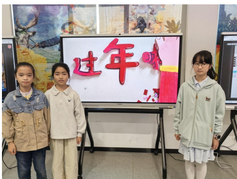
作者：新河小学 颜语诺 陈芯瑶 徐芷涵 徐芷夕 苏憬 指导老师 陈梦宁

拍摄时，我们逐帧移动动作部位，比如捏饺子的手指、蹦起来的鞭炮，让画面活泼有趣。最后，全家人围坐吃年夜饭，定格在举杯的温馨画面！