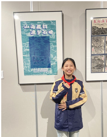
作者：大溪小学 王歆羽 指导老师 赵丹君