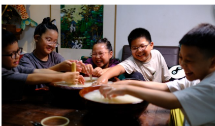
作者：泽国三小 赵俊杰 瞿祺 杨露喻 指导老师 赵丹英