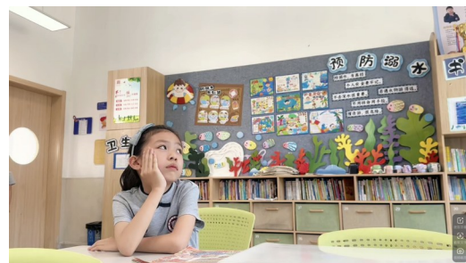
作者：五龙书院 郑闵文 江昀泽 指导老师 林任怡

这是一个充满温情的微电影剧本。我们特意设计了双线并行的结构，让女儿的委屈和父亲的辛劳同时上演，就像画中的冷暖色调相互碰撞。最终，所有的情感都在“愿望”这个主题下融合。这让我们觉得，生活就像一个广阔的舞台，每一位在远方为家庭和传承奋斗的父亲，都是他人生故事里沉默而伟大的主角。即便相隔山海，爱与理解也能穿越信号，照亮彼此的世界。