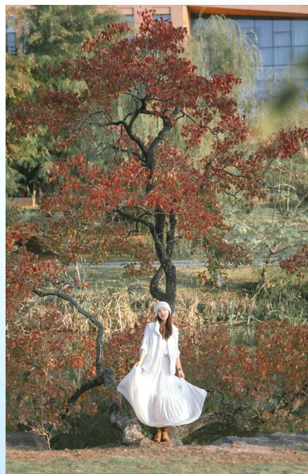
@星星牧歌摄影：每到深秋，就想起这株湖边的乌桕树。