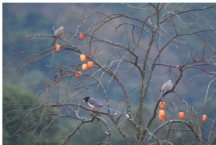
@寒江渔翁：秋去冬来万物休，唯有柿子挂枝头。

温岭的秋，是大自然打翻的调色盘。银杏鎏金，丹枫染赤，每一帧都是时光写就的散文诗。来“温岭+”，让我们一起，收藏这份限定版的秋日浪漫。