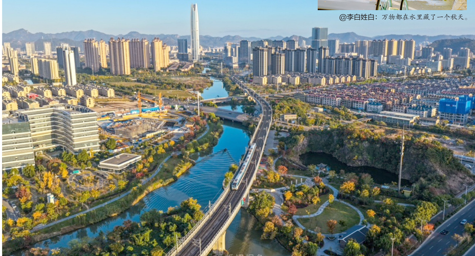
@正版梧桐鱼：瞰见温岭之冬至江南秋未央。