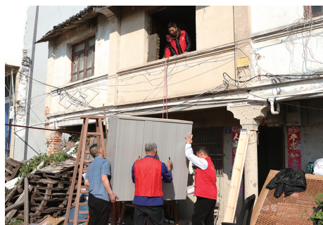
众人合力将家具搬运上楼。

为方便大件家具搬入，大家默契地将二楼窗户更换留到最后操作。众人合力将1.5米长的整套床具拆解，楼上楼下接力传递。仅10多分钟，床垫和床架便被顺利安置进房间。 随后，二楼窗台修整迅速展开：旧窗清边、新不锈钢窗安装同步进行。一楼的志愿者拌好水泥，随时递送支援。很快，新窗缝隙被水泥填实，崭新窗台完整呈现。 接着，房间布置随即开始。为圆小琪的紫色梦想，志愿者早有准备：紫色窗帘、带紫色元素的衣柜与书桌依次就位，通体紫色的床上四件套也铺设整齐。窗帘拉起，灯光点亮，清新柔和的紫色映入眼帘。小琪欣喜不已，开心地与自己的房间合影留念。 “亲情小屋”公益项目是市党员服务中心与箬横爱心联盟服务队共同发起并实施的