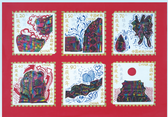
市三中九(2)班 蔡依琪 指导老师 叶蓉蓉