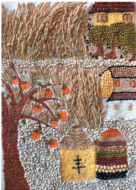
滨海小学二(七)班 陈老师 林海燕 陈梦晨