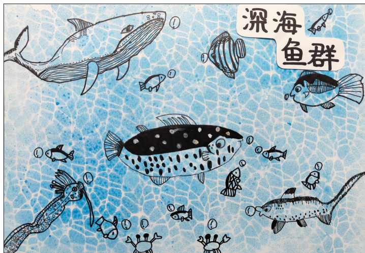
深海鱼群 大溪小学二(5)班 江一竹