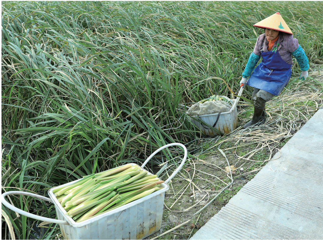
11月18日，新河镇郑洋新村，农户在收割冬季茭白。眼下，“茭白之乡”新河镇6000多亩冬季茭白陆续进入成熟期，农户们穿梭在田头收割茭白，沉浸在丰收的喜悦中。当地农户根据不同品种茭白的特性，在一年里巧妙地实行早晚双季种植模式，大大提高了土地利用效率，每亩收入超过2万元。

“我们希望以此次活动为纽带，让孩子们在玩乐中理解‘干净做事、清白做人’的道理，也让职工们在沉浸式参与中重温廉洁初心，以家风建设助推企风清朗，为集团高质量发展筑牢廉洁根基。”市场集团党委书记、董事长张云彬说，未来集团将持续丰富清廉“6+1”品牌内涵，创新廉洁文化传播形式，让清廉元素深度融入生产经营、团队建设、家庭共建等各个场景，让廉洁教育从阶段性活动变为常态化浸润，推动形成人人崇廉、人人守廉的良好生态。