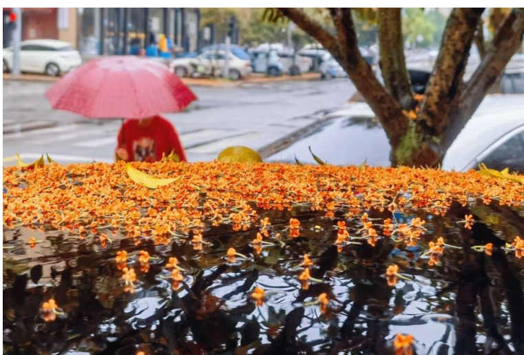
@车来潮往: 秋风秋雨桂花落。