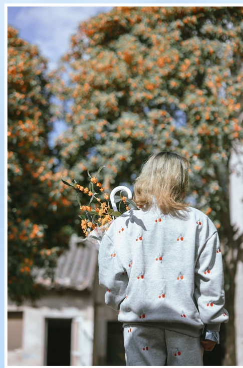
@星星牧歌摄影: 香气先花到。