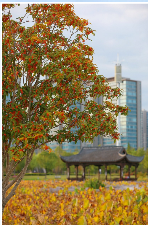
@华野: 九龙湖桂花香。