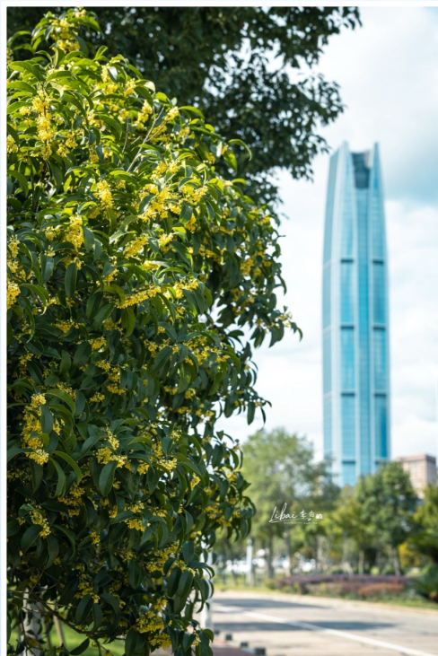
@李白姓白: 一川风鸣, 满城桂香。