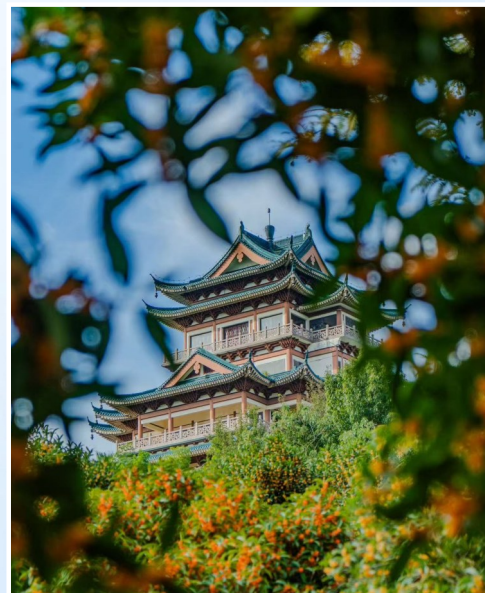
@潘果汁: 满城尽带桂花香。