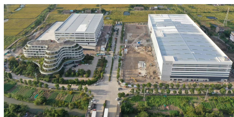
农业科创服务中心项目目前已进入收尾阶段。