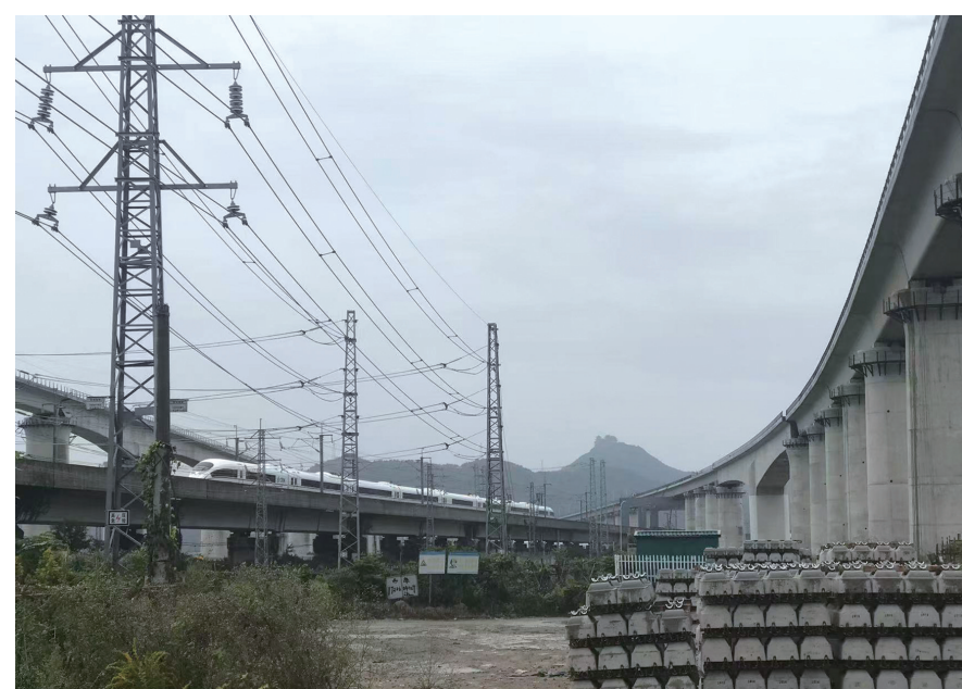
毛头村内铁路密布，远处还能看到楼旗尖