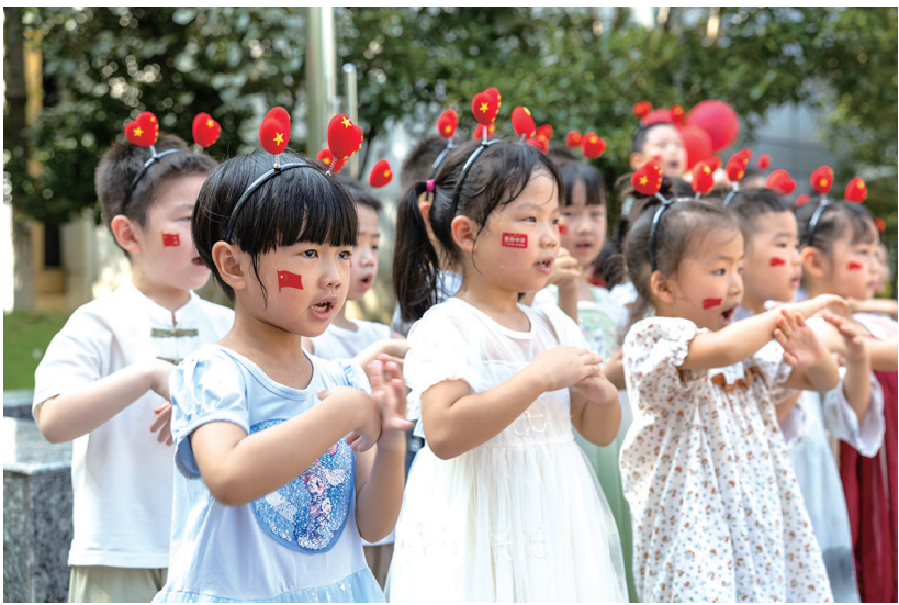
9月29日，市级机关幼儿园开展“童心迎国庆”主题活动，以孩子喜闻乐见的方式，将家国情怀融入趣味体验。在“传统文化”“现代文明”“国防科技”等学习情境中，孩子们沉浸式感受家国文化魅力，喜迎国庆节。