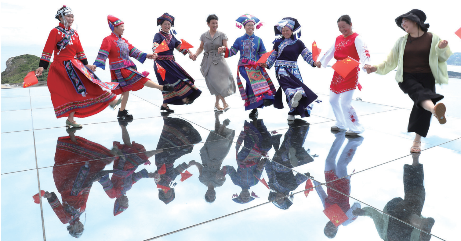
各族群众在松门山海之韵景区的天空之镜上欢快地跳起民族舞。

簪横校园里，300多名学子拼出“中国76”字样献礼祖国；松门山海之韵景区内，各族群众载歌载舞，庆祝新中国76周年华诞；九龙汇公园中，几名青年用红布条摆出五角星造型，用青春力量庆贺新中国生日；文明实践主题公园里，市民举旗健步跑，唱响爱国曲；市级机关幼儿园内，孩童在趣味体验中种下爱国种子。一幅幅画面，呈现温岭喜迎国庆节的浓情瞬间，充满节日喜悦与爱国情怀。