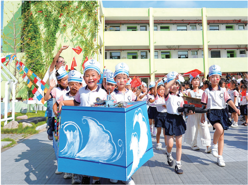
9月30日，滨海镇实验幼儿园开展“童心迎国庆 场馆游中国”主题活动。孩子们通过趣味“迷你阅兵”，抒发爱国情感。