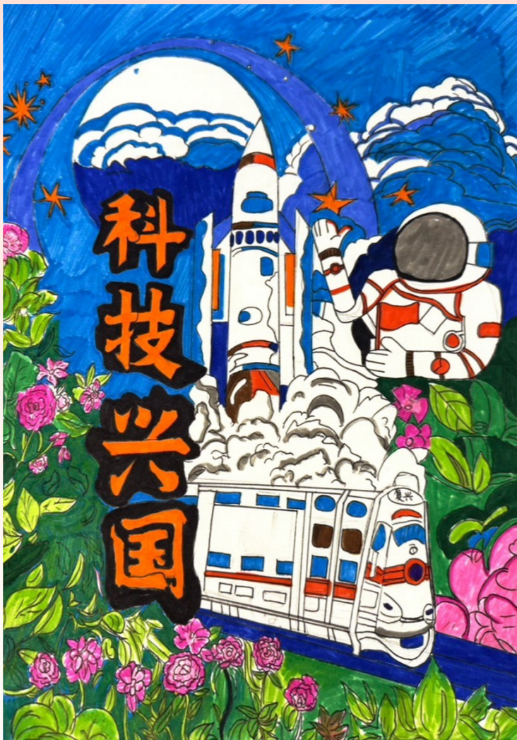
箬横小学五(2)班 林鑫妍 指导老师 江庆辉

回望这条路的变迁,从泥泞的土路到平整的水泥路再到宽阔的柏油路,从夜晚的漆黑到如今的灯火明亮,从出行的麻烦到如今的便捷顺畅,每一点变化都是一代人努力的成果,更是时代发展的象征。这条路,连着这座城,也连着我的家,更是祖国蓬勃发展的缩影。作为中国人,看着家园日新月异,看着祖国繁荣昌盛,我的心里满是自豪——我为这片土地喝彩,更为自己是中国人而骄傲!