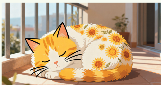
太平小学二(3)班 郑梓希 指导老师 谢玮玮