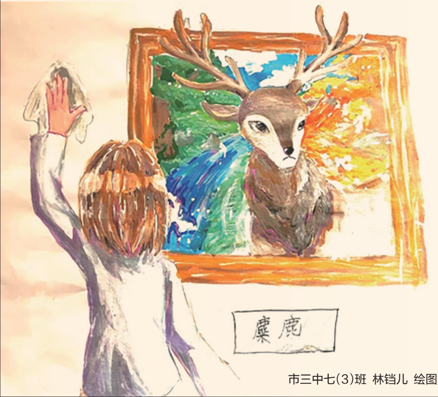
市三中七(3)班 林铠儿 绘图

他不仅是带领麋鹿族走出困境的英雄领袖，更是勇于突破自己的桎梏、打破自私的枷锁、涅槃重生的英雄！