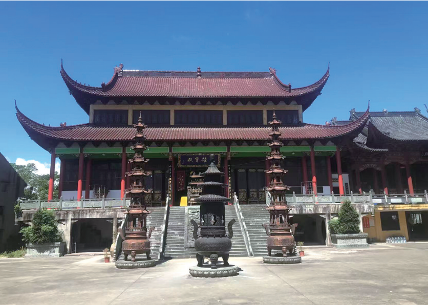
水晶禅寺大雄宝殿