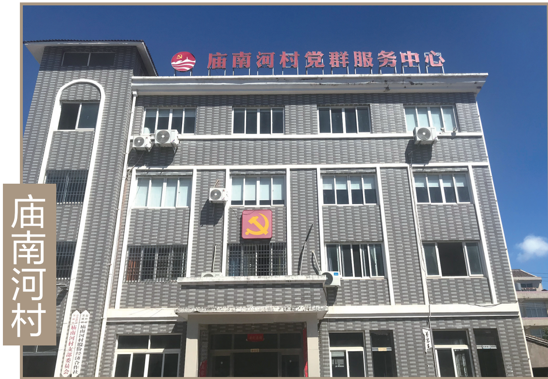
庙南河村党群服务中心

吾南乡白峰山、石龙冈、红岩背、高浦吞诸水，曲折而注诸海，其河曰猫儿河，而人皆不知所由名及所自始。予考嘉靖叶《志》称朱紫阳于此筑塘建闸时，镇海口以铁猫，故以是名。然此河之开浚及建筑