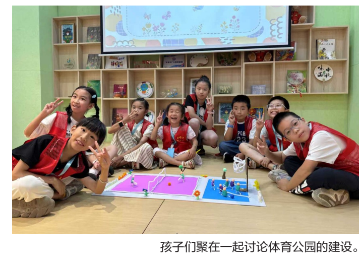
孩子们聚在一起讨论体育公园的建设。

目理想体育公园的模样。回到社区后,孩子们将创意落地,利用纸箱、彩纸、黏土等材料,动手搭建出体育公园模型。