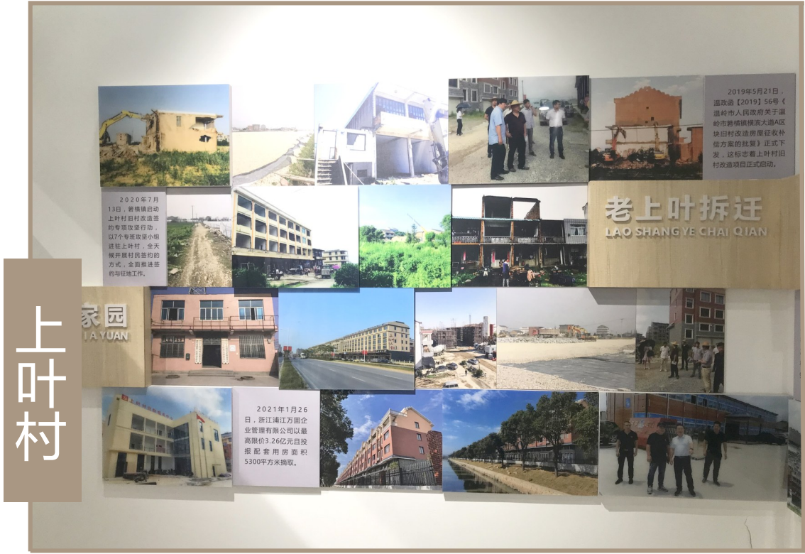
文化礼堂内村庄整治照片。