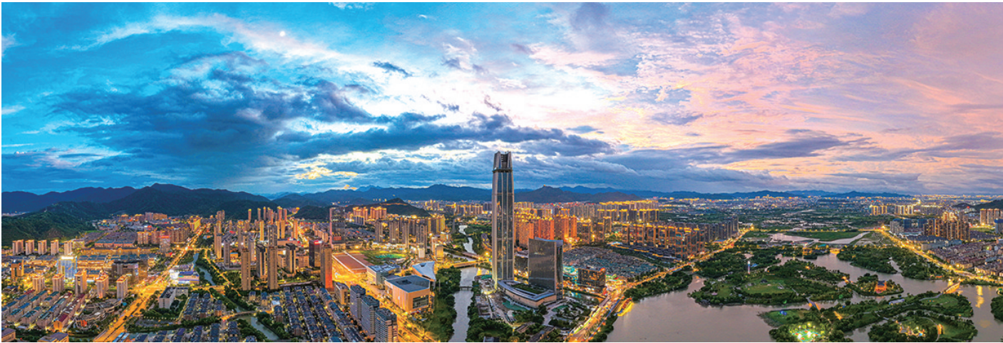
拍摄地：九龙汇公园