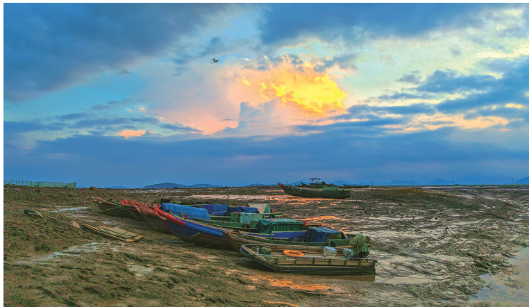
拍摄地：坞根伏屿山