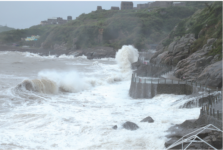
拍摄地：洞下沙滩