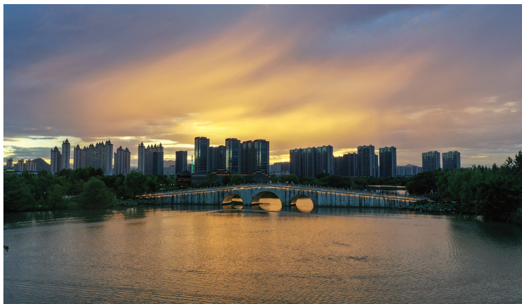
拍摄地：九龙汇公园