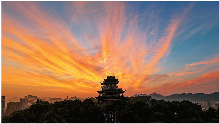
拍摄地：市区东门桥