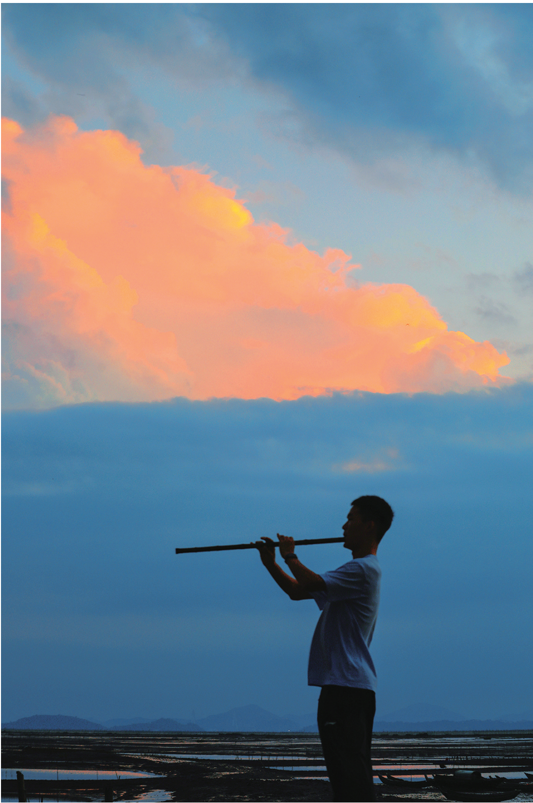
拍摄地：坞根伏屿山

台风季的温岭，大自然展现出别样的魅力与力量。天风呼啸、云卷云舒、霞光辉映、海浪翻涌，这些独特的景象，留下了一幅幅震撼人心的画面。 狂风掠过街巷，将树梢拧成灵动的曲线，旗帜在风中舒展成鼓胀的帆，那是天风在大地上写下的狂草；云层则在天上演着瞬息万变的魔术，厚重的积雨云如奔涌的山峦，纤细的卷云似飘逸的丝带，鱼鳞般的卷积云又像铺展的锦缎，每一次变幻都藏着不期而遇的惊喜。 而台风前后的霞光，更是将这份灵动推向极致。橘红、绯红、紫金在天幕上层层晕染，与翻滚的云团碰撞出惊心动魄的美，仿佛天地间最绚烂的调色盘被打翻，为温岭镀上一层梦幻的光晕。当视线转向海岸，惊涛骇浪正以雷霆万钧之势拍打礁石，雪白的浪花如碎玉般飞溅，在礁石的棱角间激荡出磅礴的交响，那是大海在台风季最雄浑的宣言。 这些由天风、云影、霞彩、海浪共同编织的画面，是温岭在台风季特别的印记。它们既带着自然的野性力量，又藏着转瞬即逝的温柔，每一张定格的影像，都是人与天地对话的见证，诉说着这座海滨城市与台风季的独特羁绊。