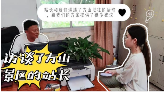
队员访谈方山景区站长。

在调研拍摄中，我们致力于全方位呈现方山景区独特的自然与人文魅力。镜头聚焦于方岩书院的古朴