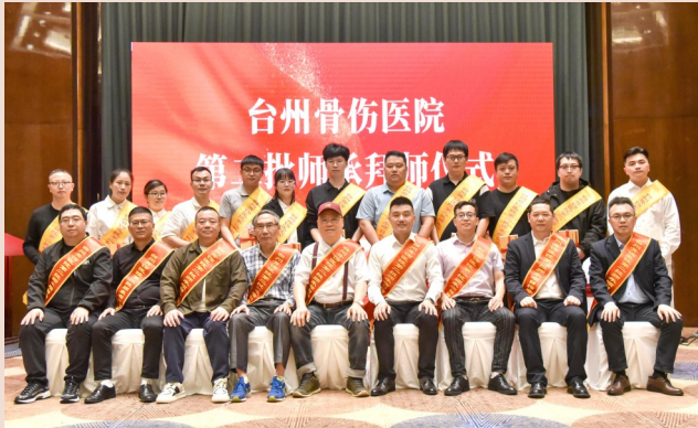
医院第二批师承项目启动暨拜师仪式。