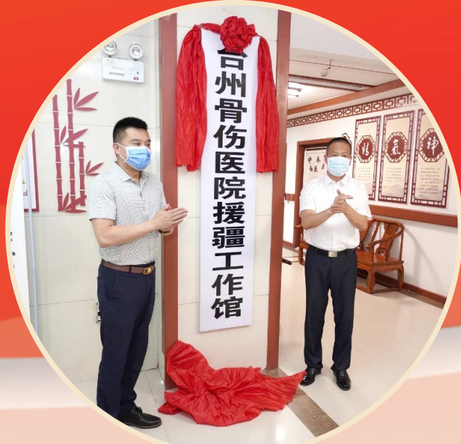
台州骨伤医院援疆工作馆揭牌。