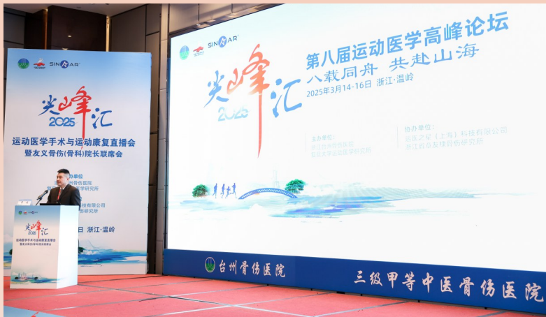
医院举办第八届“尖峰汇”运动医学高峰论坛。