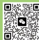
温岭电视台小记者